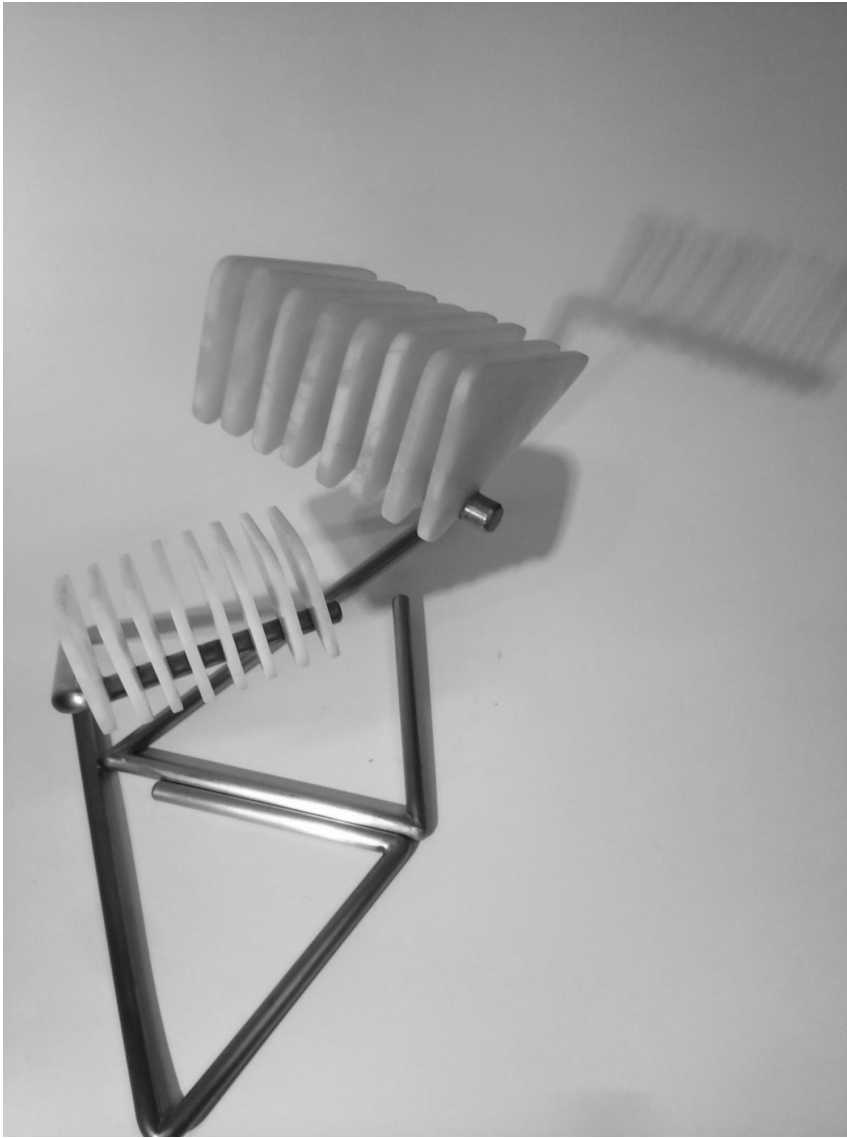
11- "A la salud de Kapoor" (J.C.) 2015 Acero inoxidable y alabastro. 30 x 34 x 20 cm. Pieza única 1.600 €